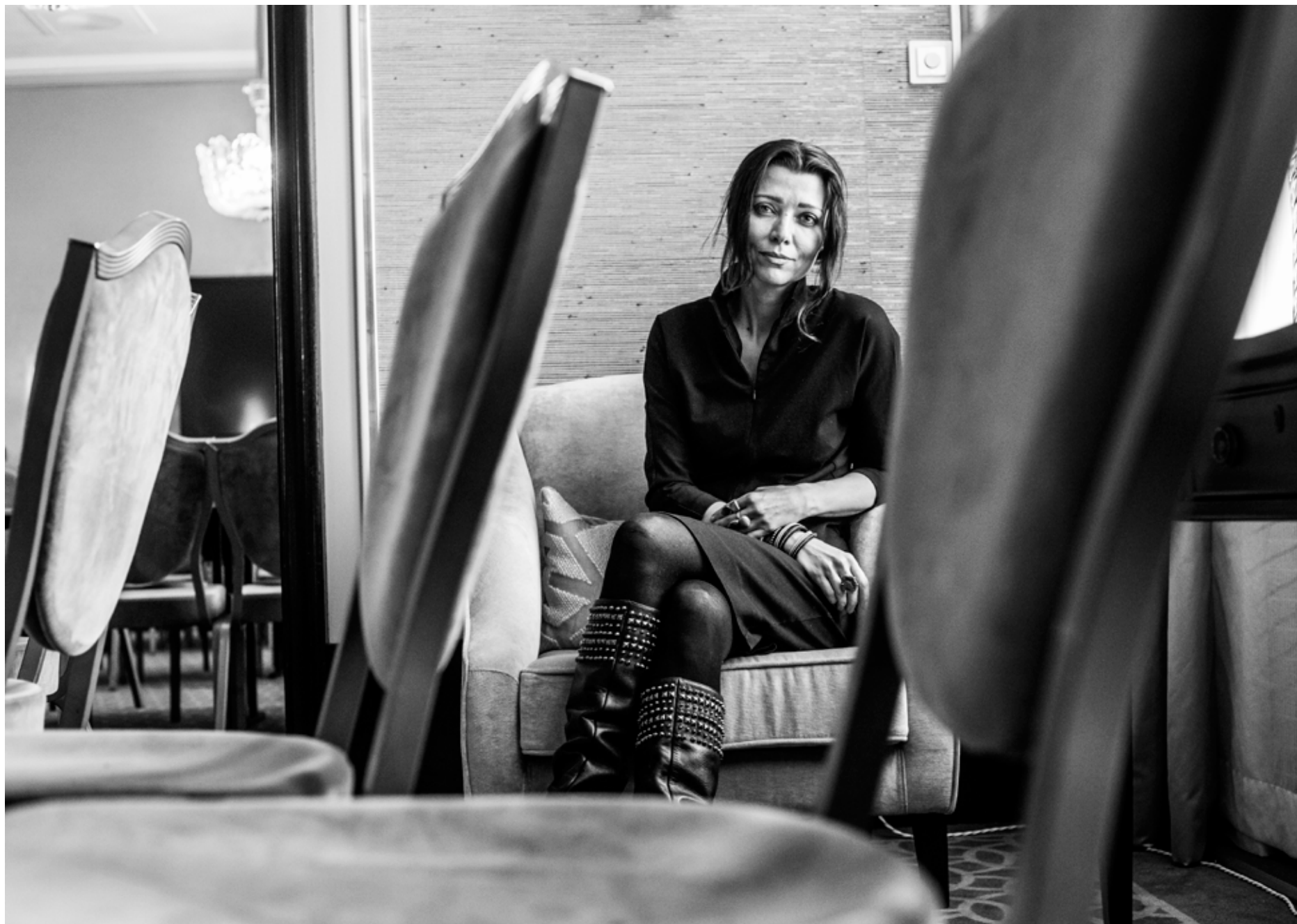
TO VERDENER: Elif Shafaks foreldre ble tidlig skilt. Hun ble oppdratt av sin mor og mormor. Moren var vestlig, velutdannet og arbeidende, mormoren hørte til en muntlig, østlig kultur. – Jeg har lett etter å bygge broer mellom deres to «verdener» i bøkene mine, sier forfatteren.